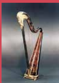
Naderman harp (original)